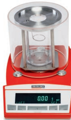
Waage + Windschutz (Plexiglas) Balance + wind protection (plexiglass)