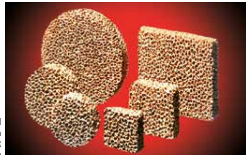
Auswahl aus dem STELEX ZR Filterprogramm