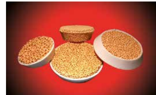
STELEX ZR Filter für den Feinguss