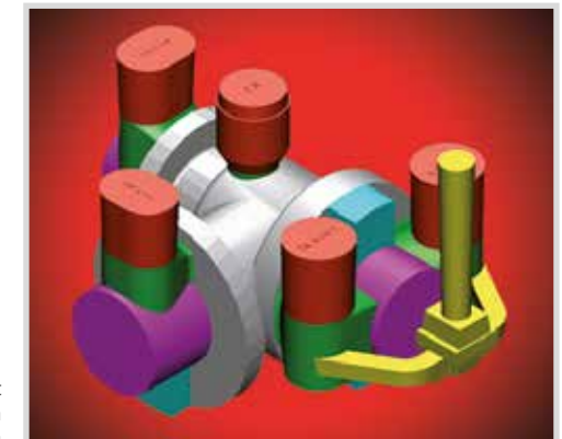
Ventilgehäuse mit Anwendung von STELEX ZR Filtern